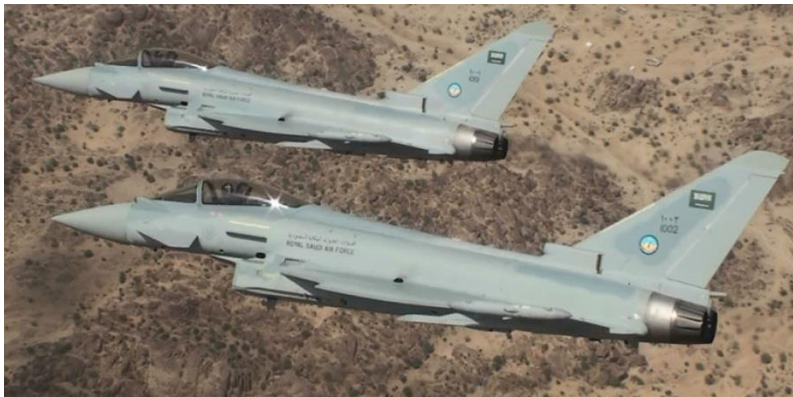
Dos unidades de Eurofighter Typhoon de la Real Fuerza Aérea Saudí

Los acuerdos de cooperación en materia de defensa suelen ser un requisito previo para la adquisición de armas; el país comprador no compra un sistema de armas sino existe una alianza militar y política con el gobierno vendedor que le garantice la adecuada transferencia tecnológica, soporte en el ciclo de vida del arma y el suministro de repuestos ante cualquier eventualidad o formación. En definitiva el comprador requiere compromisos de cooperación y acuerdos políticos entre los dos gobiernos. Al margen de estos acuerdos de cooperación, también pueden establecerse acuerdos de financiación que acompañan a los contratos de adquisiciones de material militar que se van a llevar a cabo.